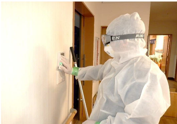
各種照明スイッチ